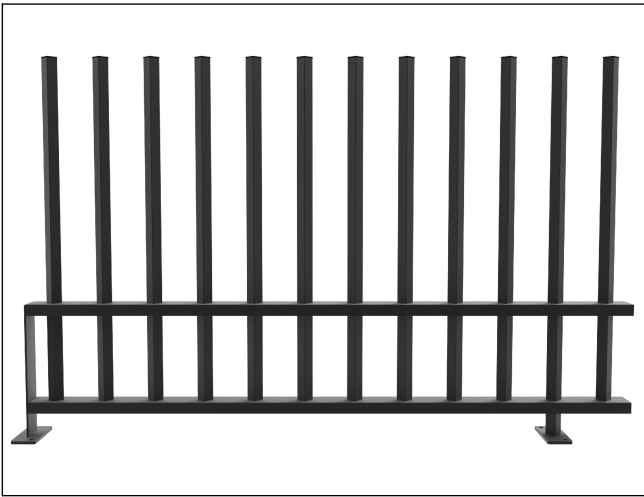
Verniciatura polveri COLORI RAL A SCELTA