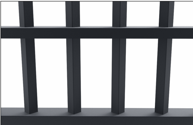
Saldature non a vista