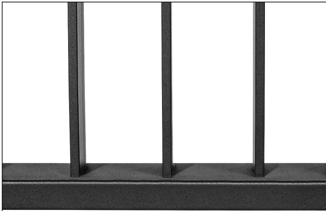
Saldature non a vista