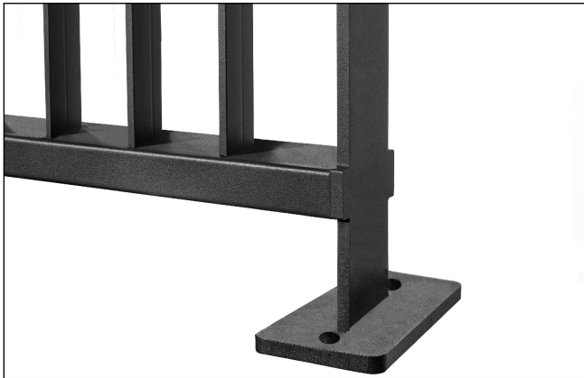
Staffa a tassellare