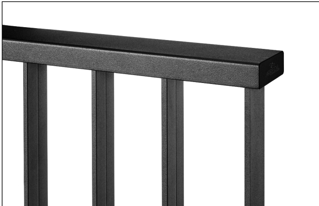
Dettaglio prof. superiore e tappo pvc nero