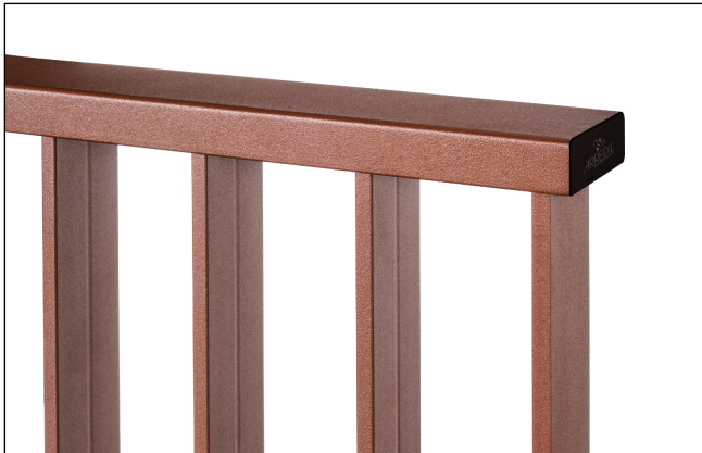
Dettaglio prof. superiore e tappo pvc nero