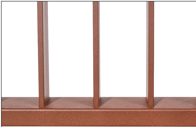
Saldature non a vista