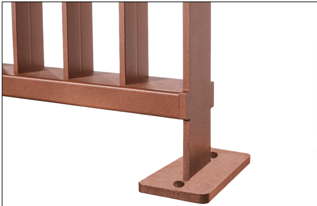
Staffa a tassellare