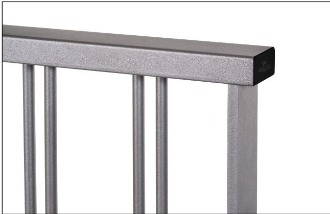
Dettaglio prof. superiore e tappo pvc nero