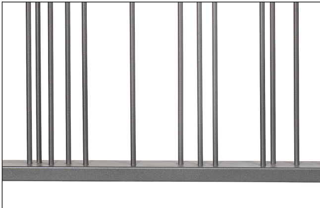
Saldature non a vista