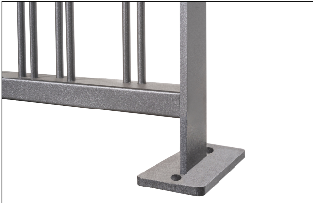
Staffa a tassellare