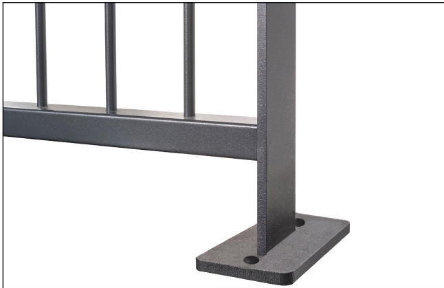
Staffa a tassellare