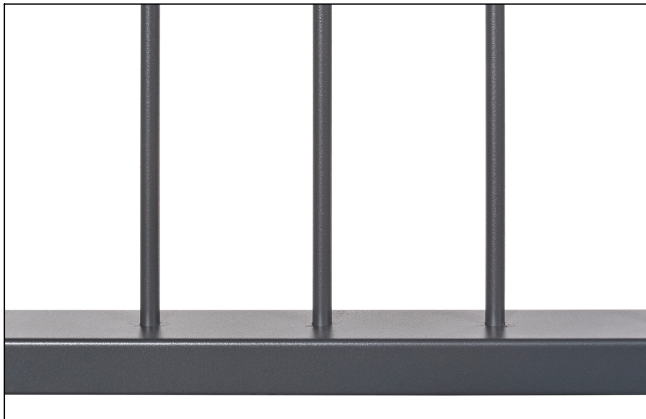
Saldature non a vista