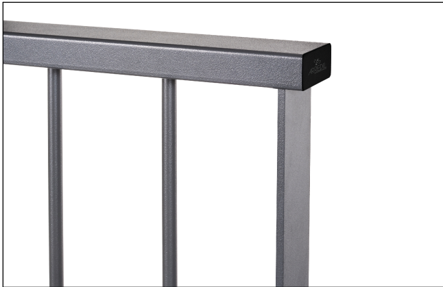
Dettaglio prof. superiore e tappo pvc nero