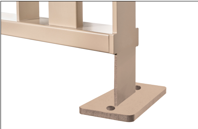
Staffa a tassellare