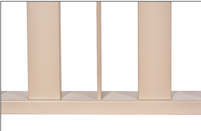
Saldature non a vista