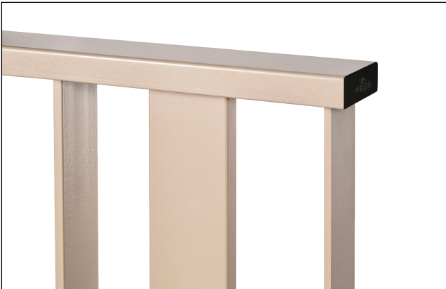
Dettaglio prof. superiore e tappo pvc nero