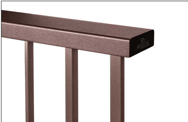
Dettaglio prof. superiore e tappo pvc nero