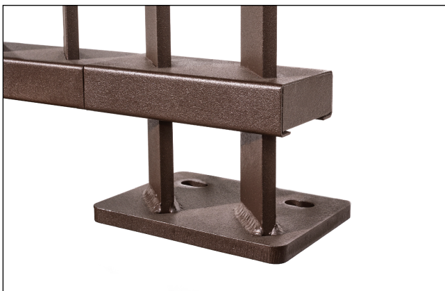
Staffa a tassellare