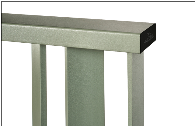
Dettaglio prof. superiore e tappo pvc nero