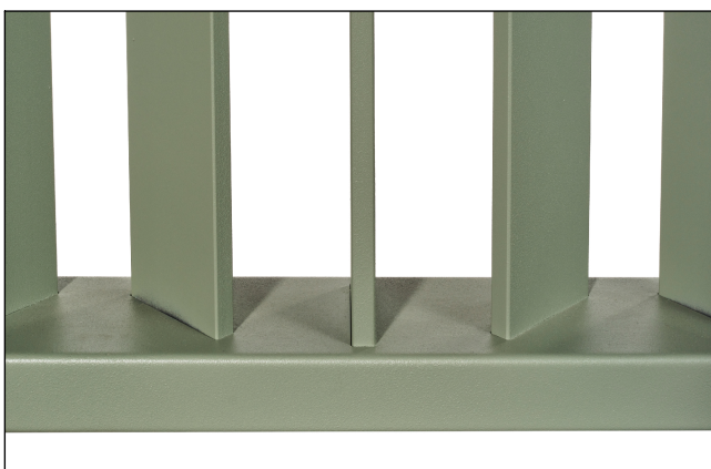
Saldature non a vista