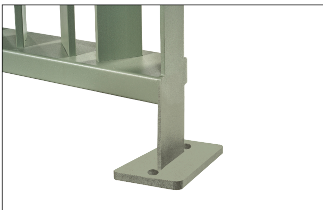
Staffa a tassellare