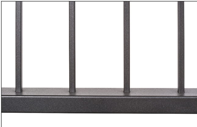
Saldature non a vista