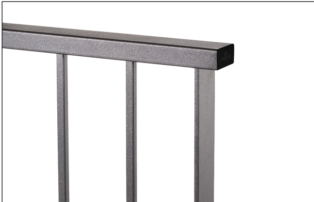
Dettaglio prof. superiore e tappo pvc nero