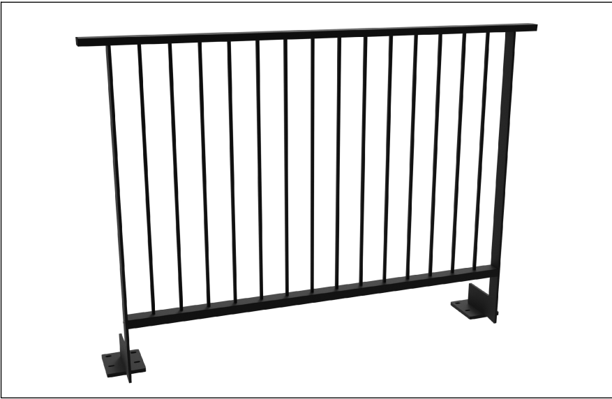
Prospetto parapetto fissaggio sopra solaio a sbalzo