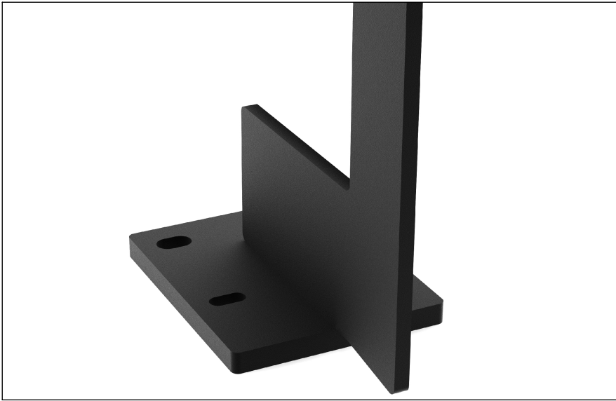
Dettaglio piastra per fissaggio sopra solaio a sbalzo